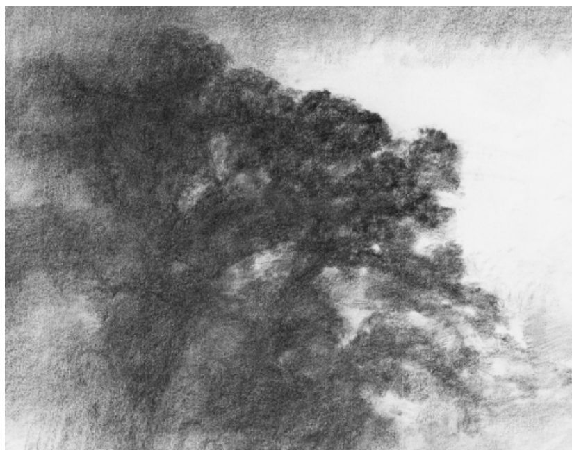
Alexandre Hollan, Le Chêne Volant , 2015, fusain sur papier, 60 x 80 cm

Chaque année, Alexandre Hollan part observer ses arbres et c'est dans le silence de cet acte qu'il traduit « les circulations d'énergies » des arbres en un tracé au fusain ou à l'acrylique qui tremble, cherche, et s'affirme dans un même mouvement. Chez Hollan, le geste est lent, il inscrit la décision de l'esprit, il existe malgré l'hésitation d'une recherche toujours recommencée et dont il rend visible le tâtonnement.