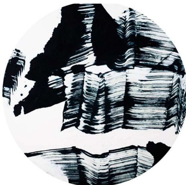
Caribai, En suspens , technique mixte sur bois, 2014, 90 x 90 cm

Les oeuvres gestuelles de Caribai sont empreintes du réel, non seulement elles se nourrissent de réminiscences de moments vécus mais aussi elles s'élaborent d'après des gestes préexistants qui, couchés sur des papiers froissés, envahissent l'atelier. Ces papiers sont utilisés par l'artiste comme autant de signes archétypaux qui composeraient son langage.