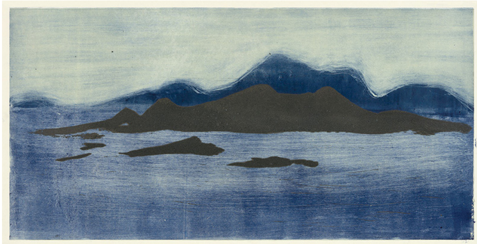
Astrid de La Forest, Magheraclogher I , 2015, monotype et gravure au carborundum sur chine appliquée, 50 x 100 cm

Pour Astrid de La Forest le geste qui découle de l'observation est primordial, si le procédé le met à distance, c'est pour mieux le voir, pour mieux ressentir l'émotion. Dans ses monotypes, le sujet est peint directement sur une plaque de verre, puis la peinture est passée sous presse. La peinture s'en retrouve ainsi inversée, le monotype est le miroir, l'image du geste originel.