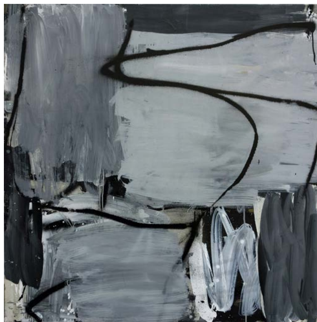
Gilles Altieri, Sans titre , 2013, huile sur toile, 120 x 120 cm

Gilles Altieri , pratique le « All over » en mettant en scène le geste et la peinture jusqu'à saturation, jusqu'au moment où la peinture devient geste et le geste peinture. Il dit lui-même : « Par les cheminements dont mon oeuvre garde les traces visibles, elle s'offre au regardeur sans pouvoir apporter de solution ni de réponse. C'est une pensée opérative dont j'ai l'espoir qu'elle transparaisse à travers les traces visibles du pinceau et de la matière.... »