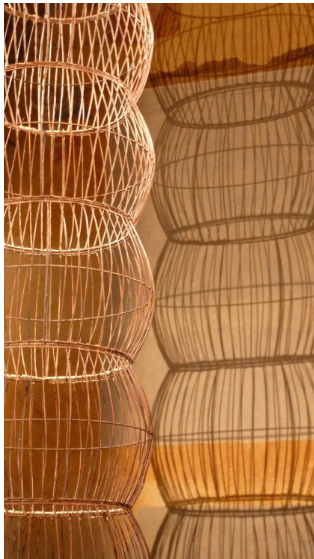
Bernadette Chéné, Hommage à Brancusi (détail), 2012, osier et métal, 770 x 160 cm

Depuis les années 1980, Bernadette Chéné est régulièrement invitée par des musées et centres d'art pour concevoir des œuvres, souvent de grande taille, spécifiquement imaginées pour les lieux qui les accueillent.