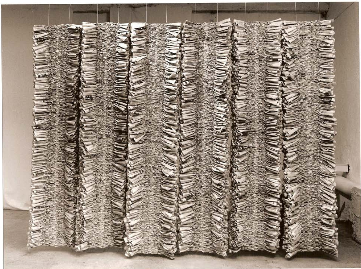
Bernadette Chéné, Les six jours du Monde , 1989, journaux tressés, 250 x 360 cm