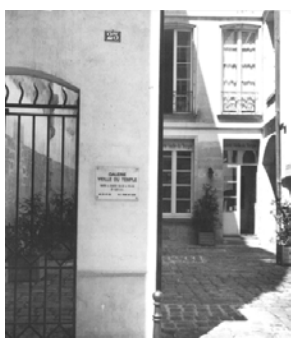
Rue Vieille du Temple, 1988