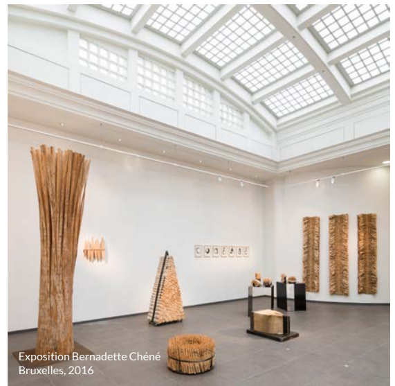
Exposition Bernadette Chéné Bruxelles, 2016