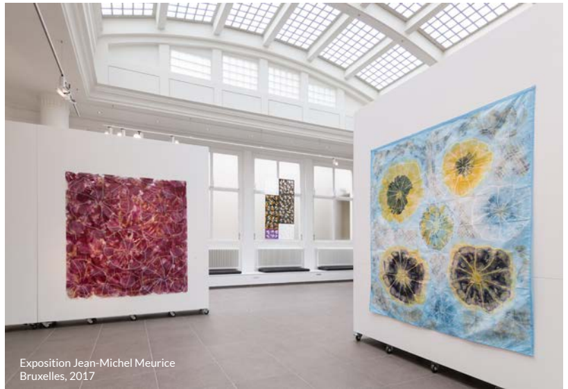
Exposition Jean-Michel Meurice Bruxelles, 2017