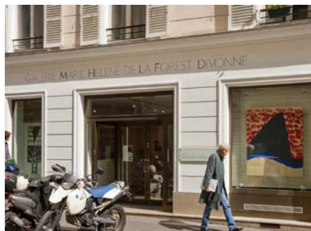
Rue des Beaux-Arts, 2015